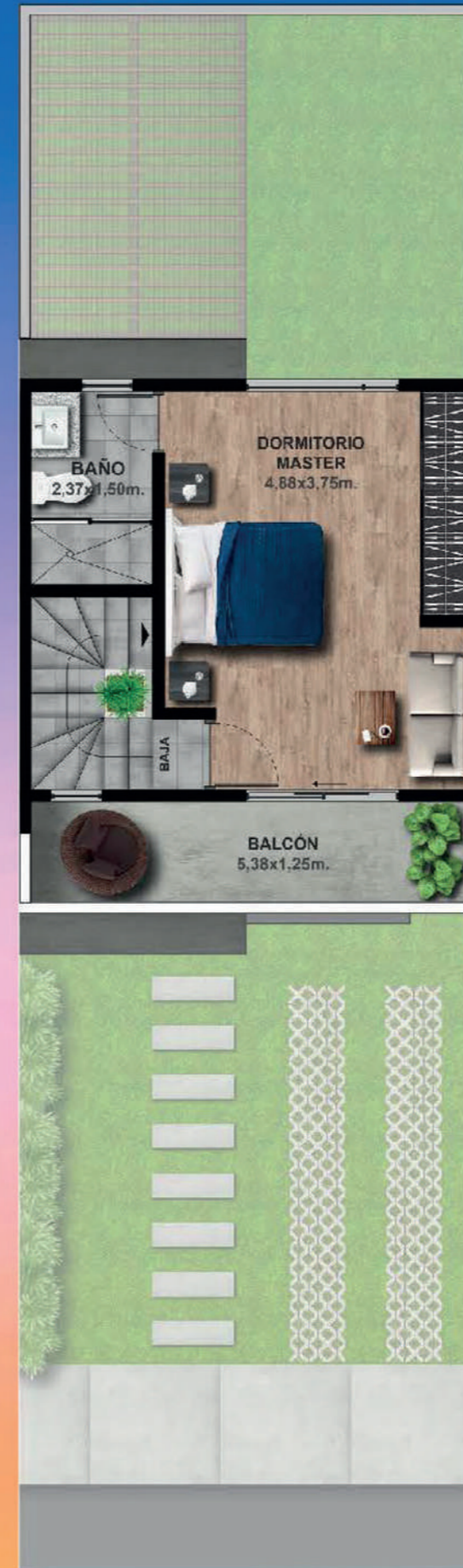
PLANTA ALTA 2 - 28,65m 2