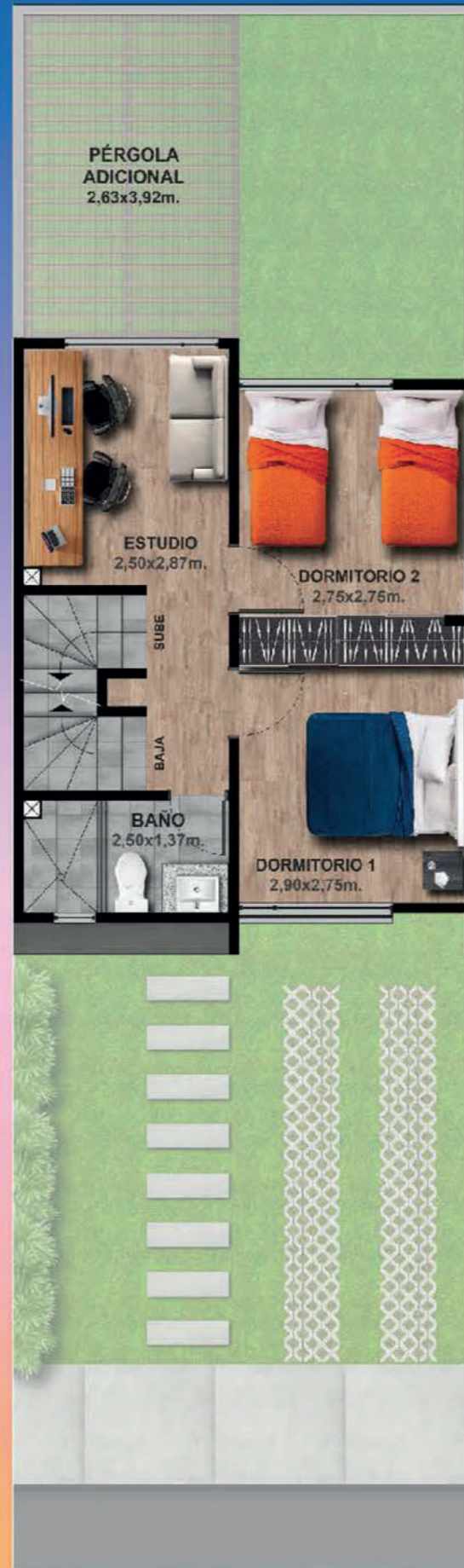
PLANTA ALTA 1 - 37,42m 2