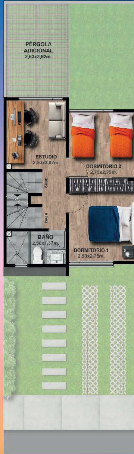
PLANTA ALTA - 37,42m 2