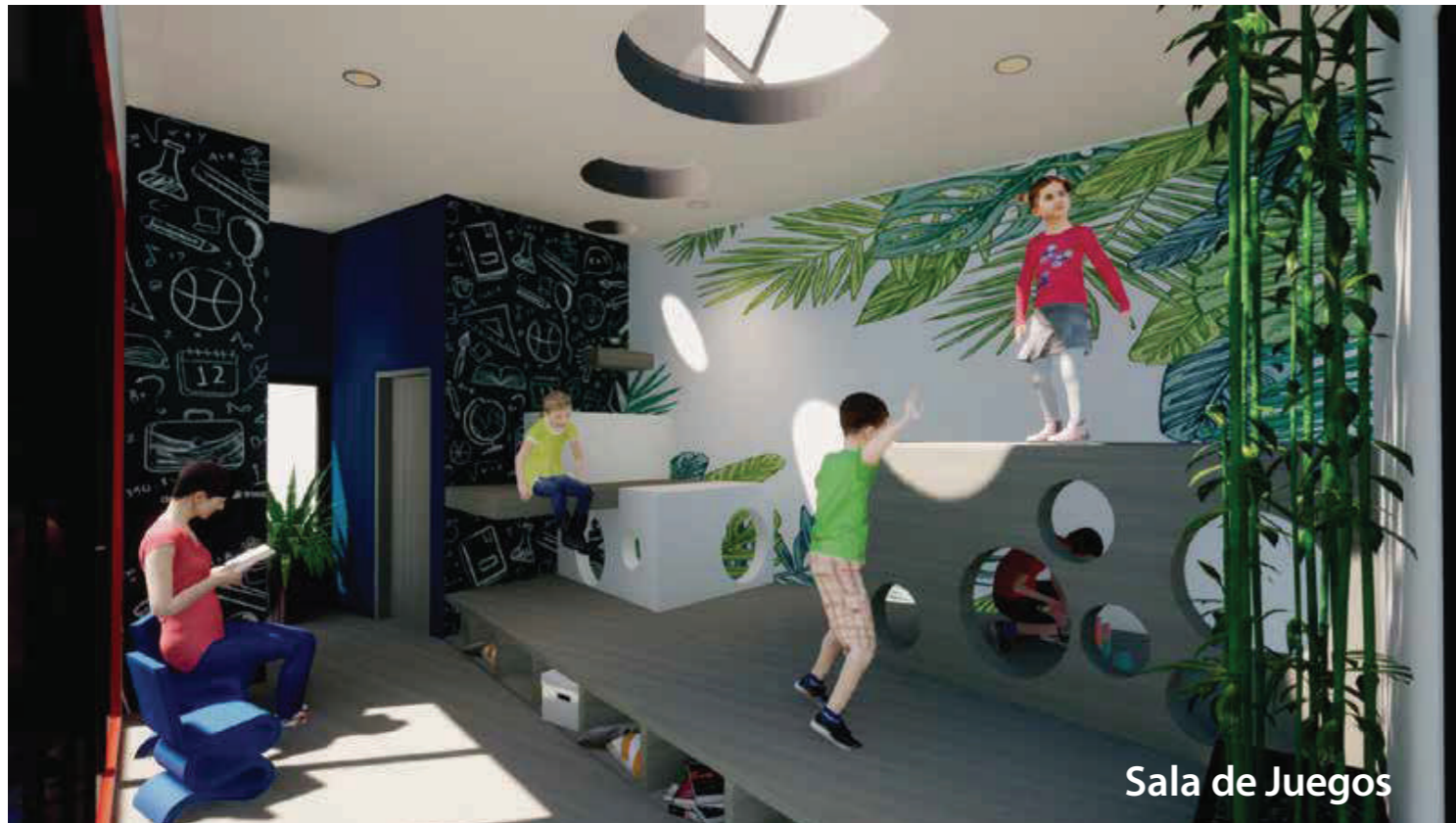
Sala de Juegos