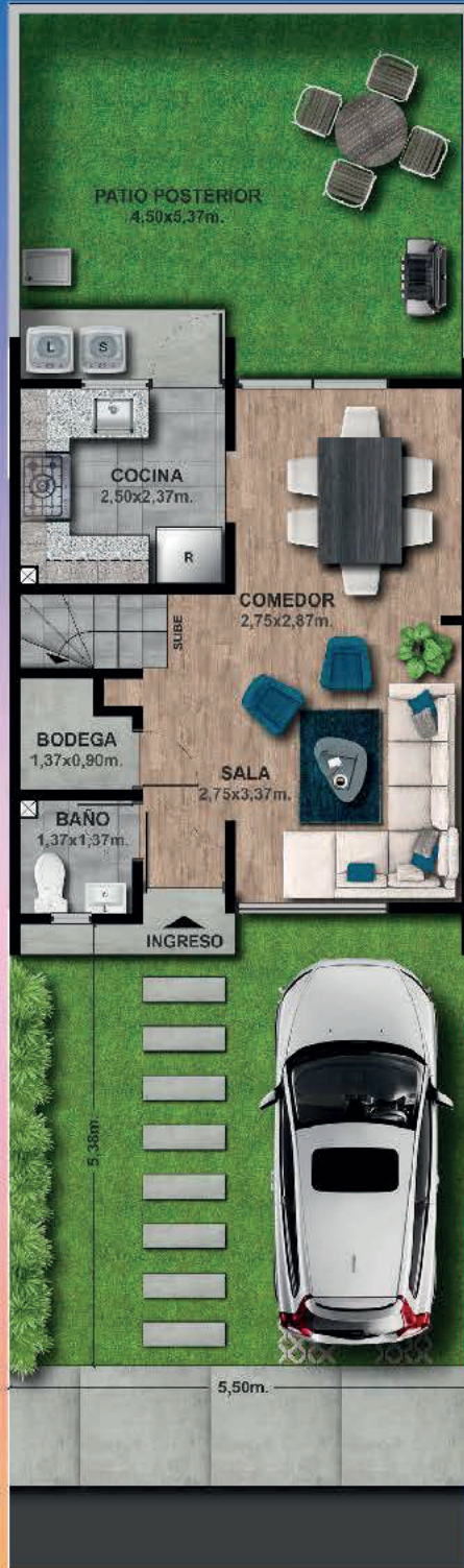
PLANTA BAJA - 35,70m 2