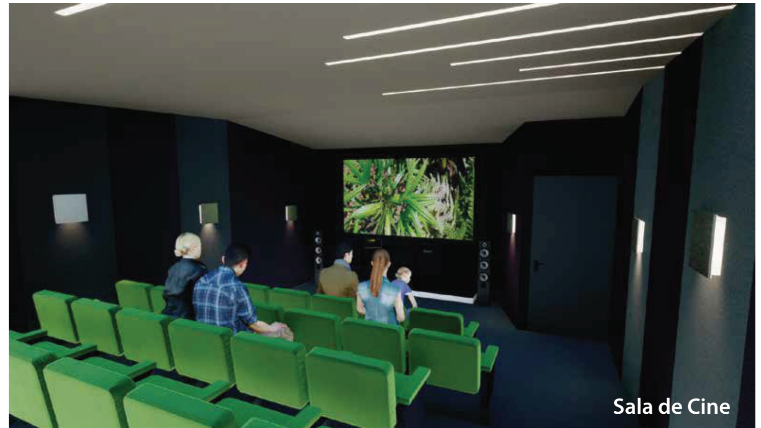
Sala de Cine