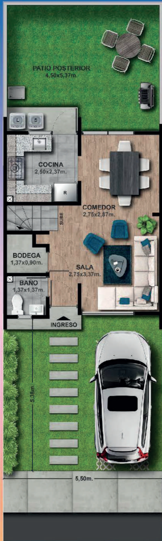
PLANTA BAJA - 35,70m 2