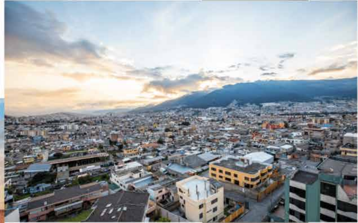
Vistas de Terrazas