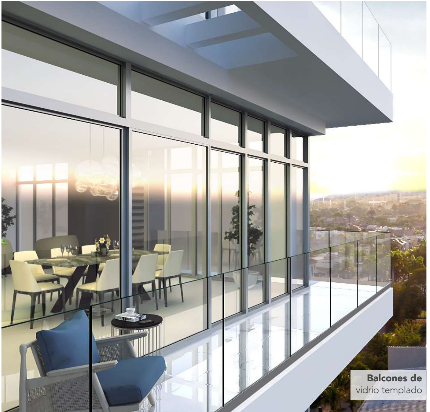
Balcones de vidrio templado