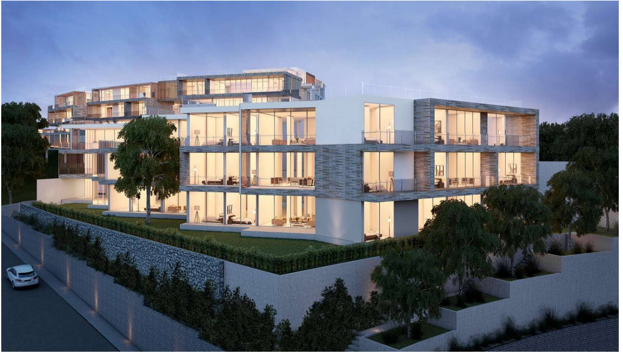
VEDERE BLOQUE C Y BLOQUE A+B EN EL FONDO