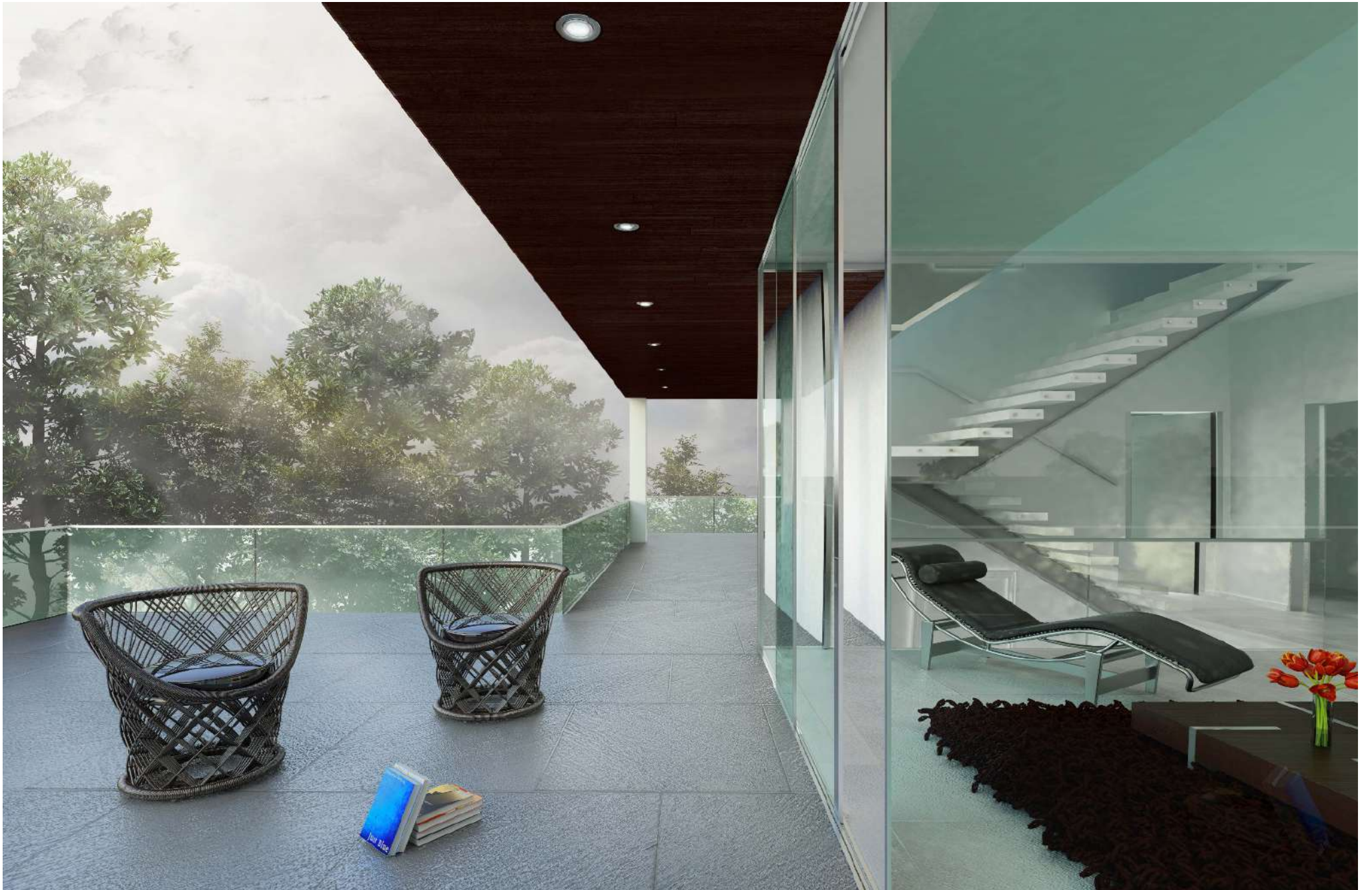
VEDERE TERRAZA E INTERIORES DEPARTAMENTO C13