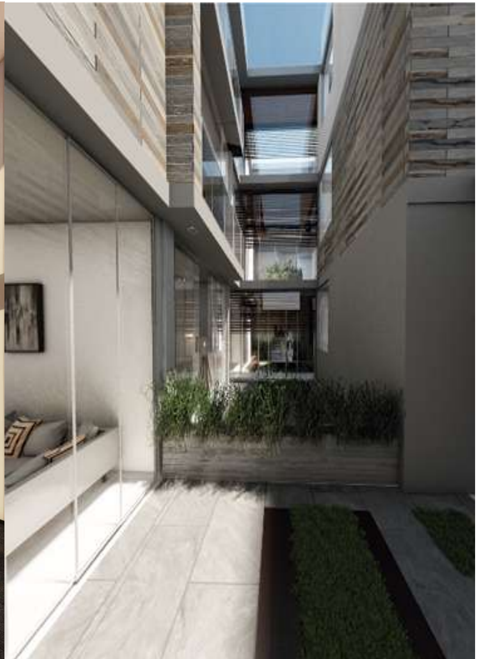
LOBBY DE VEDERE || JARDIN INTERIOR DEPARTAMENTO C3