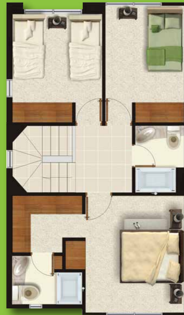
Planta Alta: 49.50 m 2