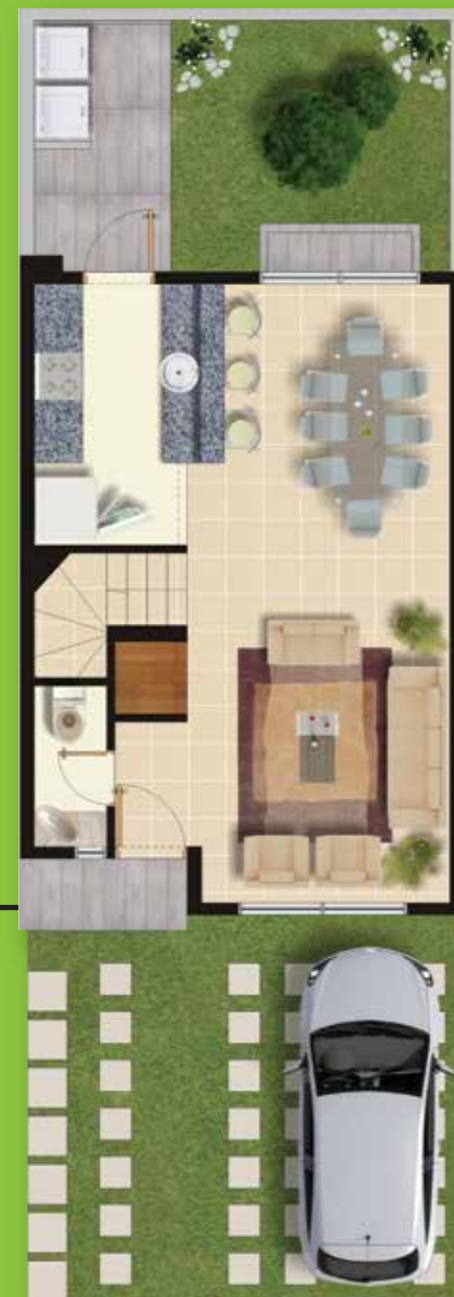
Planta Baja: 41.50 m 2